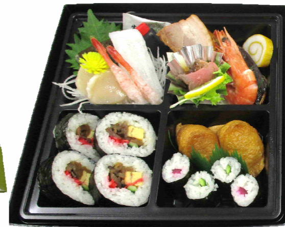
二段折詰 《蘭》 3,500円 (税込) (助六寿司入り)