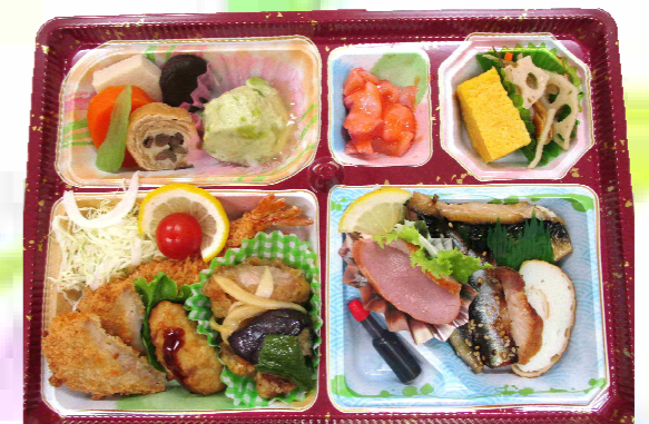
折詰 《梅》 1,200円 (税込)