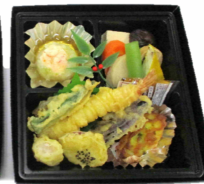
二段折詰 3,500円 (税込)