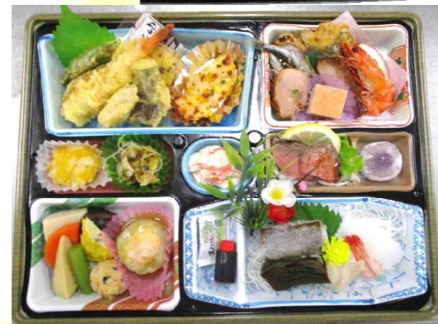
折詰 《松》 3,500円 (税込)