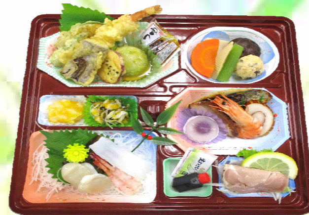
折詰 《竹》 2,400円 (税込)