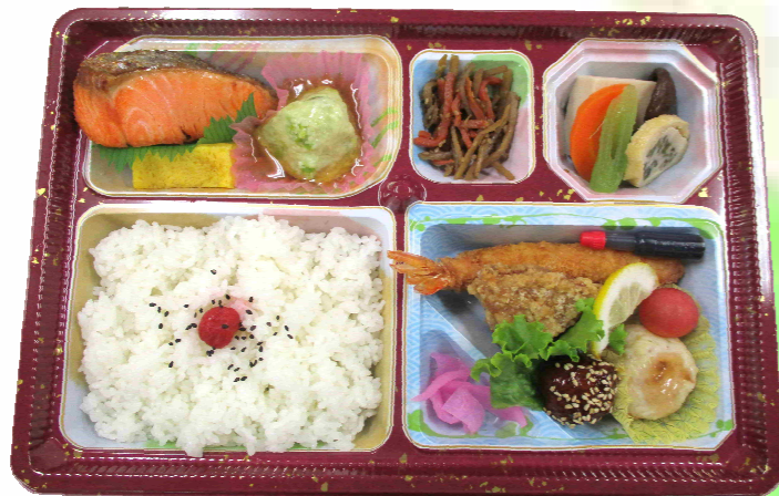
幕の内弁当《茜》 1,000円 (税込)