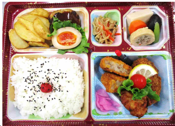
氷見弁当 1,200円 (税込)