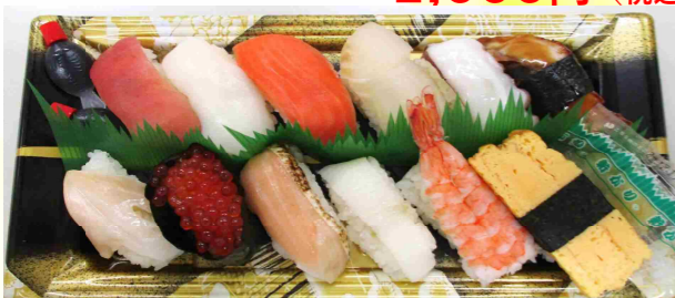
にぎり盛合せ (12貫) 1,080円 (税込)