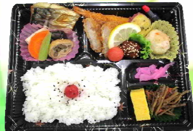
幕の内弁当《藍》 800円 (税込)