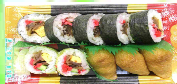
助六盛合せ 600円 (税込)