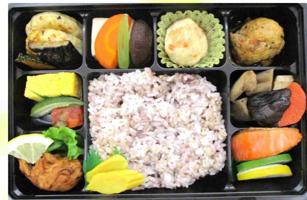
ヘルシー弁当 1,200円 (税込)