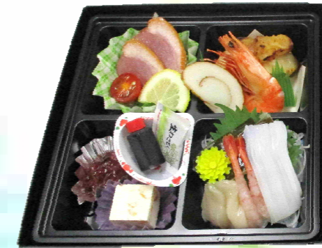
二段折詰 《藤》 2,400円 (税込)