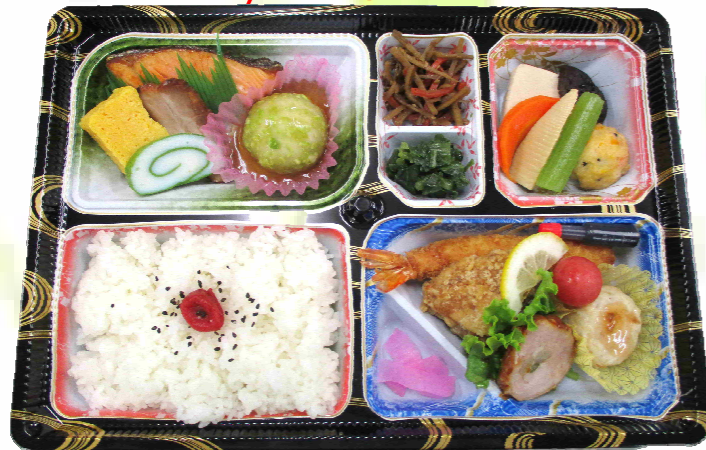
幕の内弁当 1,200円 (税込)