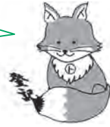
不動産登記推進イメージキャラクター 「トウキツネ」