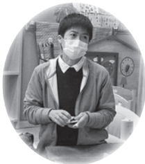
パパ、ママも是非、子どもと一緒に夢中になって遊んでください。

子どもにとって良いおもちゃとは自然と手にとって遊びたい要素があり、遊びの中で新しい発見を繰り返し見つけられ、飽きることなく遊べるおもちゃです。木製のおもちゃは、素材の持つ質感やぬくもりが五感を刺激し、豊かな感受性を育みます。脳が著しく発達する乳幼児期には、知的能力を高めるだけでなく安定した情緒も育み、頭と心と身体のバランスのとれた成長を促すことができます。