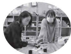
箸を使ったおもちゃにママ達も真剣!!

お薦めのおもちゃ。一見、普通に見える1枚の板ですが、積んだり組んだりして、子どもの成長に応じた楽しみ方ができるおもちゃです。