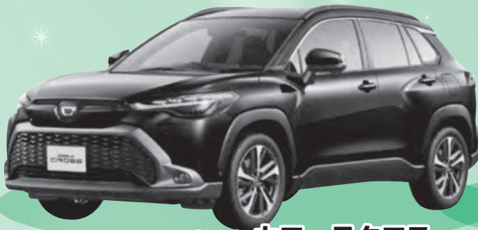
トヨタ カローラクロス