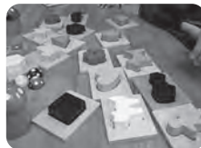
はじめは…型はめのおもちゃから。