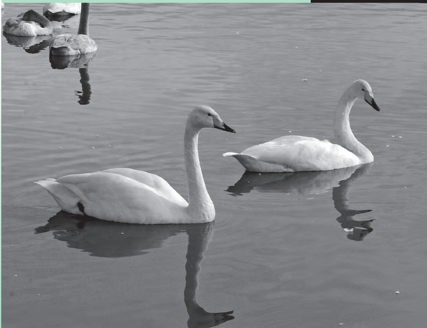
布施地内の水田にて