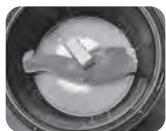
↑炊飯器の中はこんな感じ!