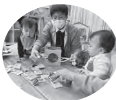
楽しいおもちゃがいっぱい。どうやって遊ぶのか教えて♡

子どもにとって良いおもちゃとは自然と手にとって遊びたい要素があり、遊びの中で新しい発見を繰り返し見つけられ、飽きることなく遊べるおもちゃです。木製のおもちゃは、素材の持つ質感やぬくもりが五感を刺激し、豊かな感受性を育みます。脳が著しく発達する乳幼児期には、知的能力を高めるだけでなく安定した情緒も育み、頭と心と身体のバランスのとれた成長を促すことができます。