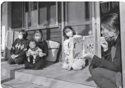
テラスで絵本タイム！

家で子どもと2人きりでずっといると 辛くなることも。 ここで話すとほっとできます。