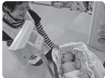
いつでも計測できますよ！