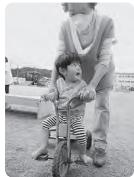
晴れた日は園周辺をお散歩したり、 園庭で遊んだりしていますよ♪