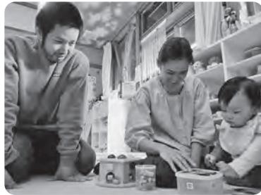
パパもいつでも気軽に来てね！