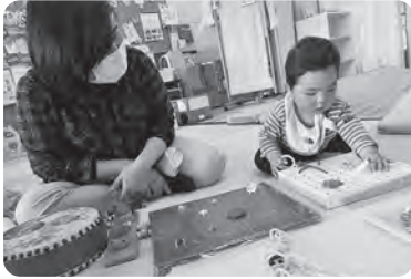
発達に合ったおもちゃを 教えてもらえるよ！

一緒に遊ぶ中で、子ども同士 いろんな刺激を受け、毎日いろ んな成長が見られます！