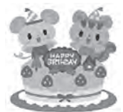
お誕生日おめでとう