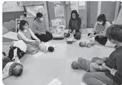
ふれあいあそびを教えてください！