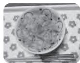
↑美味しく炊けました…いただきます