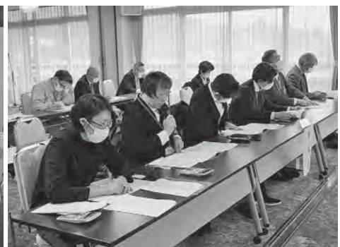
事務局より議事提案