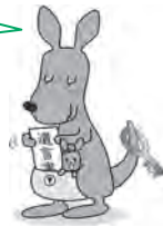
遺言書はかんガルー