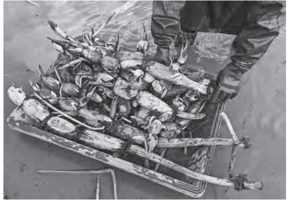
収穫したレンコンは、根切り、洗浄、乾燥などの調整作業を経てJA直売所に出荷されます。