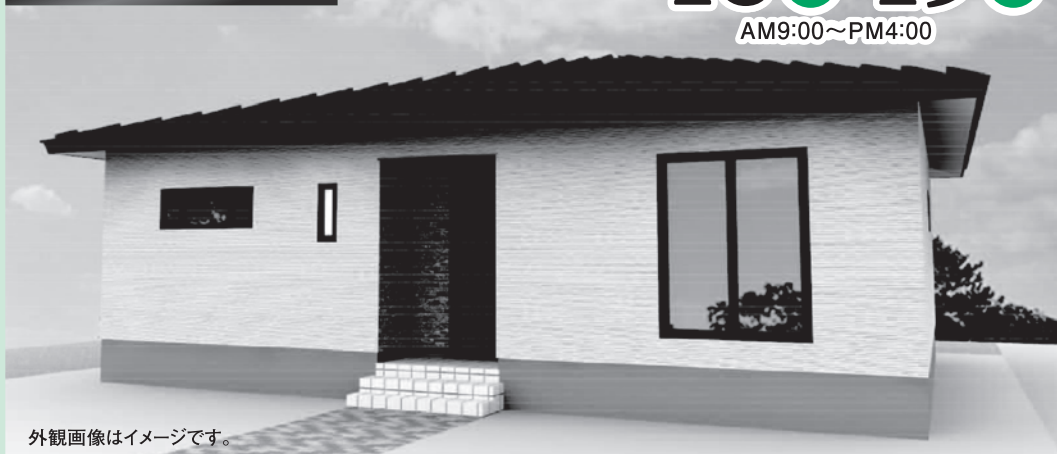
外観画像はイメージです。