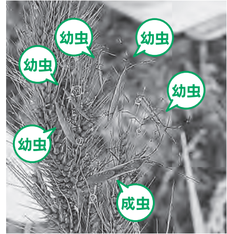
ヒエに集合するクモヘリカメムシ