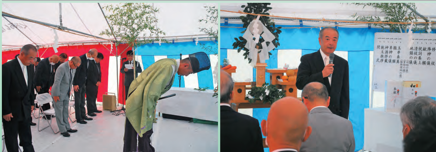
※9月27日「起工式」の様子 ~詳細はP9~