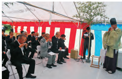
お神酒で乾杯する参加者

10月に地元の組合員・代表者等、来賓の方々をお招きし『竣工式』を行い、「南部支店」が正式オープンとなります。