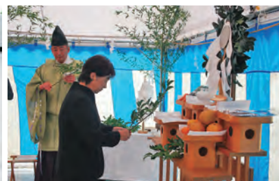
玉串を奉納する両國副組合長