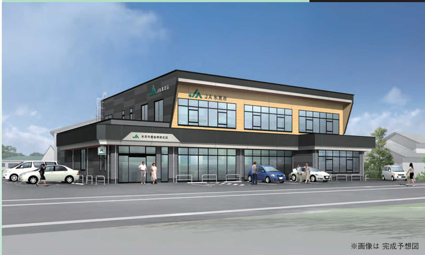
※画像は 完成予想図