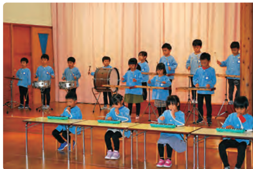
ぞう組 / 合奏「オクラホマミキサー ～みんなが英雄～」