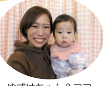
ゆずはちゃん&ママ