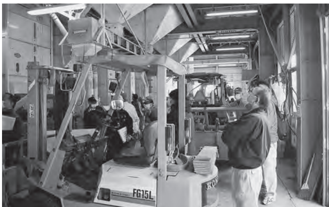
寺飯久保営農組合 乾燥施設にて