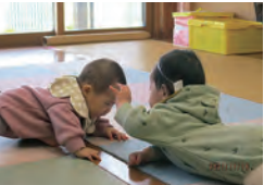
ゆずはちゃん&ひまりちゃん “一緒にあそぼう”!!