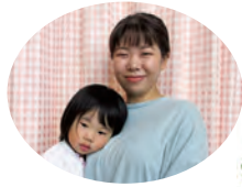
まなかちゃん&ママ

みどり保育園 子育て支援室 すくすくサロン ☎91-1277 月～金の毎日 9時～11時30分 / 13時～15時30分