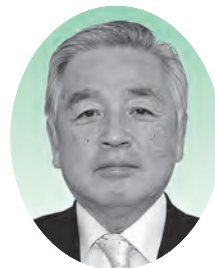
JA氷見市代表理事組合長