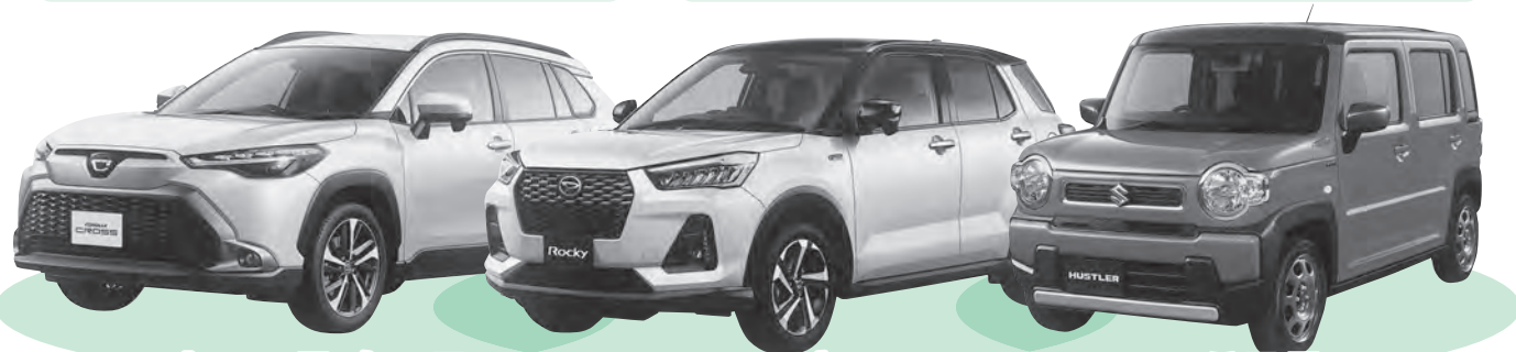
トヨタ カローラ クロス