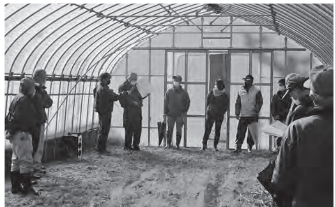
育苗ハウスでの現地研修の様子