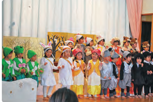
ばんだ組 / 劇あそび「てぶくろ」