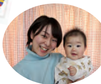
ひかりちゃん&ママ