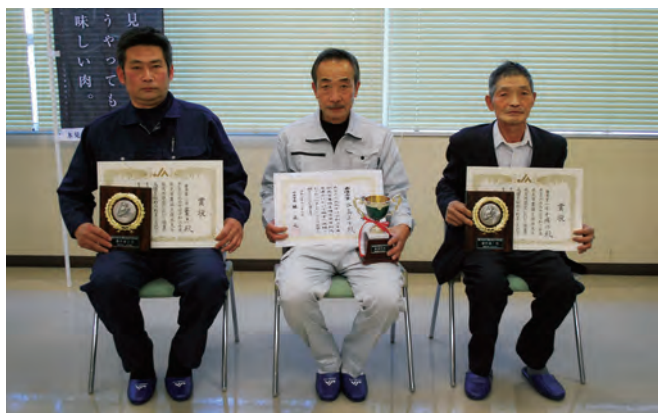
入賞生産者の皆さん

またセリでは、外食機会の増加や贈答品としての年末需要の高まりから、比較的高値で次々と落札されました。