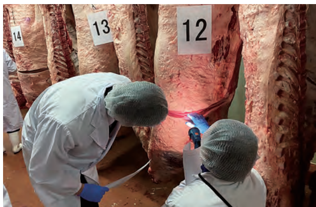
枝肉の肉質審査の様子