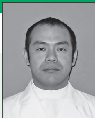
厚生連高岡病院 泌尿器科診療部長