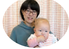
つむぎちゃん&ママ