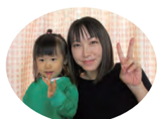
りっかちゃん&ママ