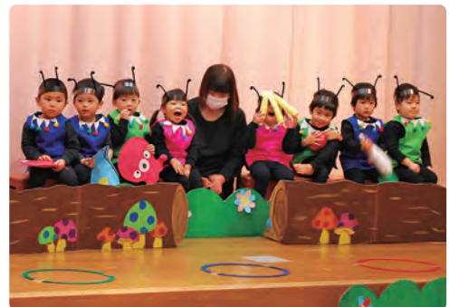
うさぎ組 / 劇ごっこ「おつかいありさん」