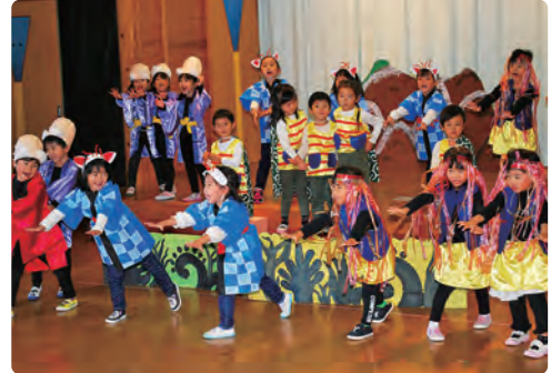
きりん組 / 劇あそび「めつきらもつきらどおんどん」