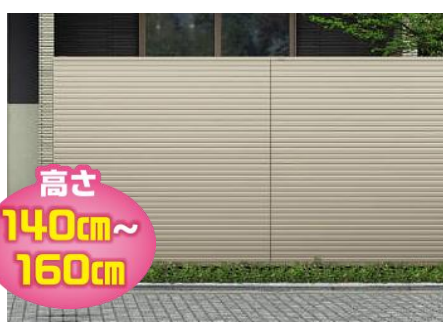
ルシアススクリーンフェンス