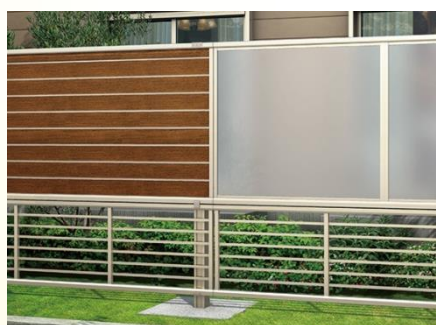
上左)ルシアスフェンス 上右・下)シンプルオフェンス