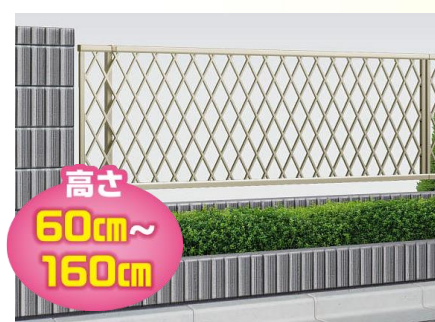
ルシアスフェンス