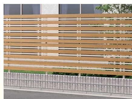
ルシアスフェンス