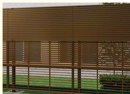
シンプルオフェンス