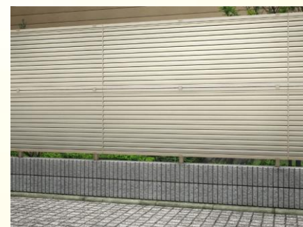
シンプルオフェンス