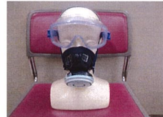
防毒マスク装着イメージ