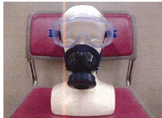
防じんマスク装着イメージ